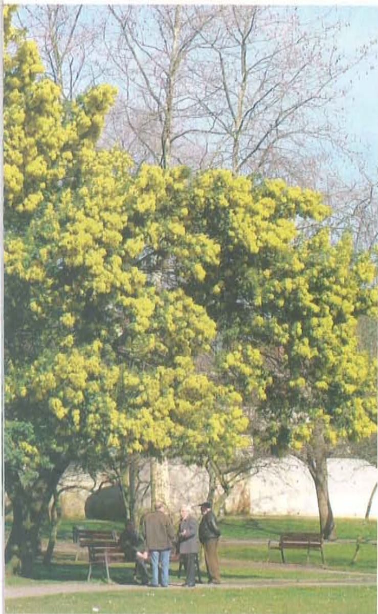
El Parque de Ferrera es el pulmón verde más importante del centro de Avilés